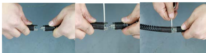
3 – Соединение и отсоединение инструмента

6. Выберите и установите соответствующий инструмент на конец троса. Т-образное соединение позволяет инструменту защелкиваться в муфте (рис. 3). Чтобы отсоединить инструмент, используйте штифтовый ключ, чтобы надавить на плунжер и сдвинуть муфту.