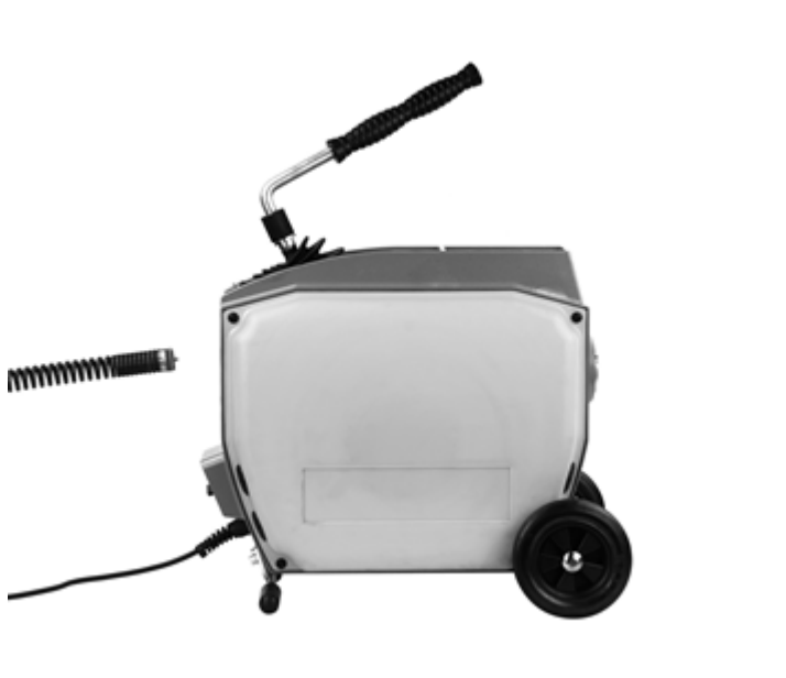
Рисунок 2 - Установка троса в переднюю часть машины

4. Вставьте трос в переднюю часть машины (сначала с внутренней резьбой) и проталкивайте далее, пока снаружи с передней части машины не останется примерно 30 см (рис. 2).